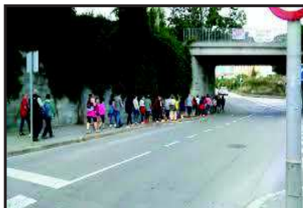
CURSA SAHARA 2017