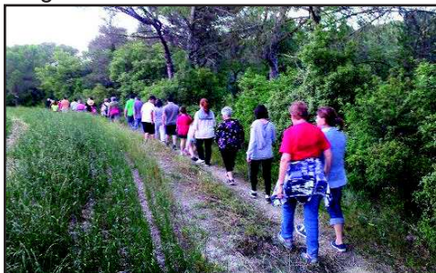
CAMPAMENT DE PAU 2017